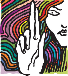
Magyar Helsinki Bizottság